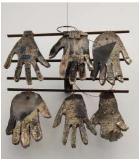
GIG Generazione In Gioco Corso Italia, 15 r Savona Mare, memoria antica dell'uomo