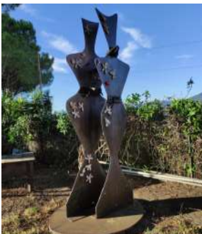
Fortezza del Priamar Corso Mazzini Savona Le viandanti