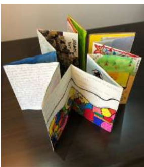
Centro Riabilitativo La Fattoria Terapeutica Via Genova, 5 Savona Oltre la tempesta