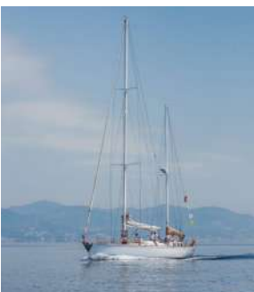
Leon Pancaldo Porto di Savona Arte irregolare